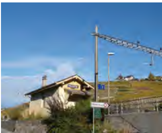
A Villette aussi... (lire en page 6)