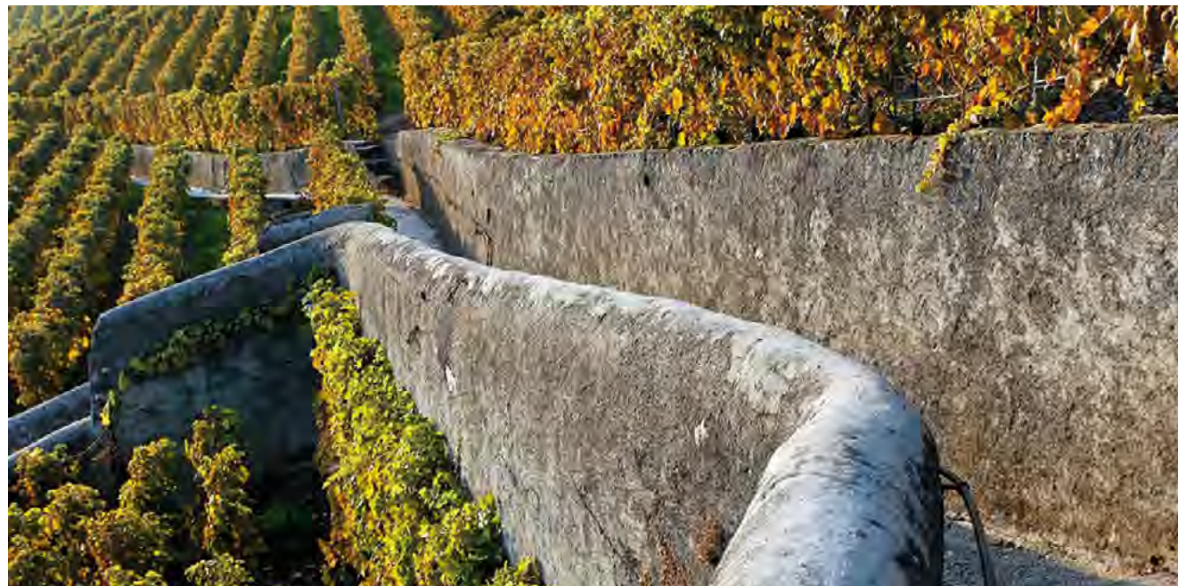
Après les vendanges, en attendant la neige...

La Commune est propriétaire de grandes surfaces viticoles que nous présenterons plus en détail dans un prochain numéro de la feuille . Aujourd'hui, non sans une certaine nostalgie, nous prenons congé de deux fidèles collaborateurs et en accueillons un nouveau.