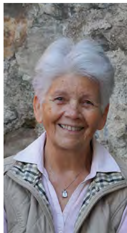
Un beau sourire pour les malades.

Actuellement, quatorze personnes (certaines étaient déjà là au tout début) consacrent leur jeudi après-midi à cette tâche. Un tournus est établi.