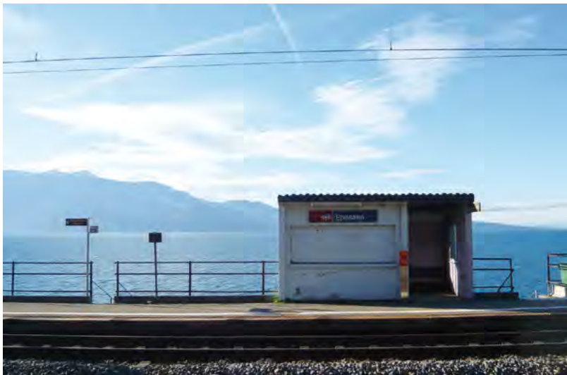
Discrète, suspendue entre vignes et lac, la gare d'Epesses

Elles ne doivent pas être bien nombrées les communes pouvant se targuer d'abriter quatre gares sur leur territoire.