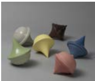
Design céramique (lire en pages 7 et 8)