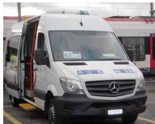
Le bus de la ligne tl 67.

ser le tracé de la ligne tl 67, doit aussi proposer une solution pour desservir Grandvaux et Aran à l'horizon 2017. Les résultats de cette étude sont attendus pour ce printemps. D'autres projets sont à l'étude dans le cadre du Plan Directeur de la Mobilité Communale (PDCM), à savoir :