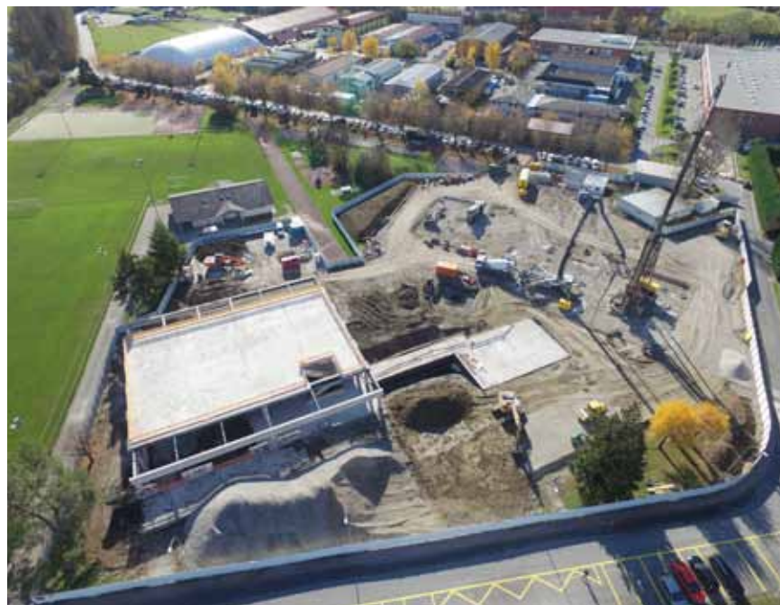
Vue du site des Verney prise en novembre 2015.