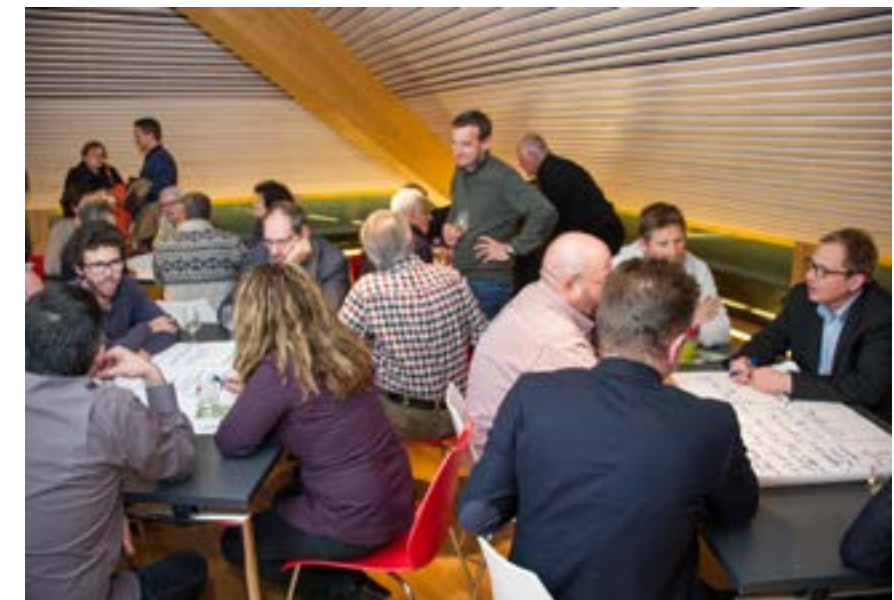
Atelier participatif durant une séance BEL Action.

Votez pour nous pour que nous puissions réaliser ces projets !